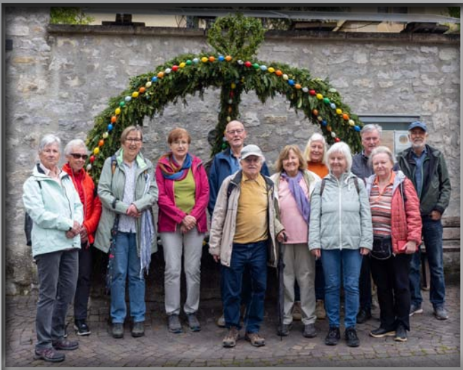
“Wanderung durchs Feuerbacher Tal”